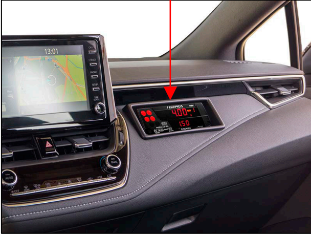
Taxameter-Einbau-Konsole im Armaturenbrett